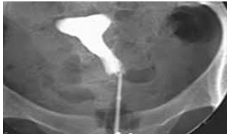
Document 2 : Hystérogographie de Madame D.

La structure 1. est la trompe, la structure 2. correspond à l'utérus et la structure 3. à l'ovaire.