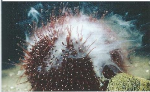
Oursin mâle rejetant un liquide blanc au cours de la période reproductive