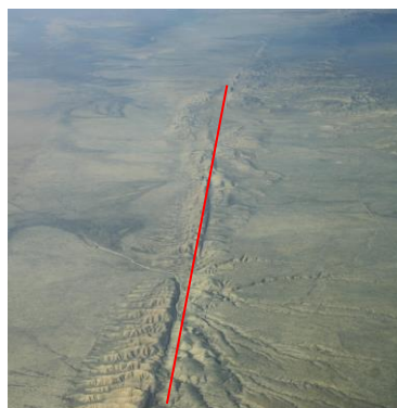
Photoaographie de la faille de San

Un cycle sismique n'est pas parfaitement régulier, il dure entre 150 et 200 ans. Les deux derniers séismes importants ont eu lieu en 1857 et en 1906.