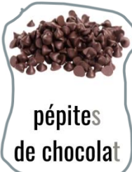
pépites de chocolat