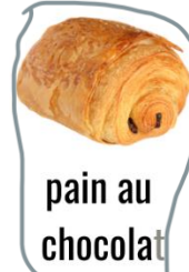
pain au chocolat