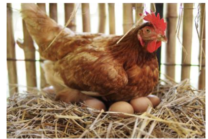
Document 1 : Une poule pondeuse

La poule peut pondre des œufs destinés à l'alimentation ou bien des œufs qui donneront naissance à des poussins. Ainsi, deux principaux types d'élevages existent : l'élevage de poules pondeuses, composé uniquement de femelles et l'élevage de basse-cour composé de plusieurs poules et d'un coq.