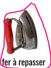
fer à repasser