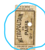
Ticket de métro