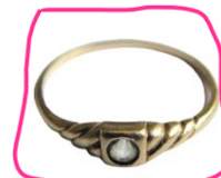
Bague de fiançailles