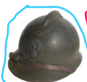
casque de soldat