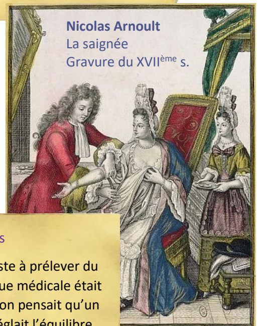
Nicolas Arnoult La saignée Gravure du XVII ème s.

Pour eux, toute maladie s'expliquait par un déséquilibre de ces humeurs.